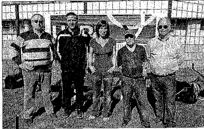
Les organisateurs du tournoi étaient très satisfaits de cette première édition.