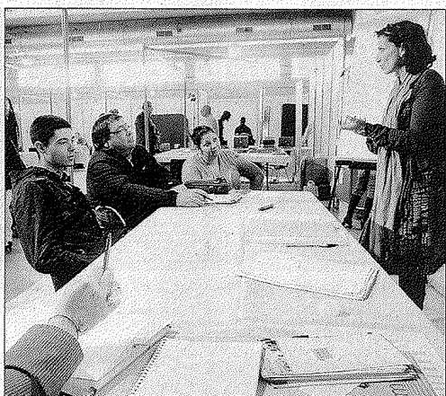
Préparation de CV (photo), formation à l'entretien d'embauche, conseils... au programme de RH-entreprendre, hier. / PHOTOS G.L.

Autre but, "mobiliser les entreprises du secteur sur le thème de l'emploi et les pousser à s'ouvrir